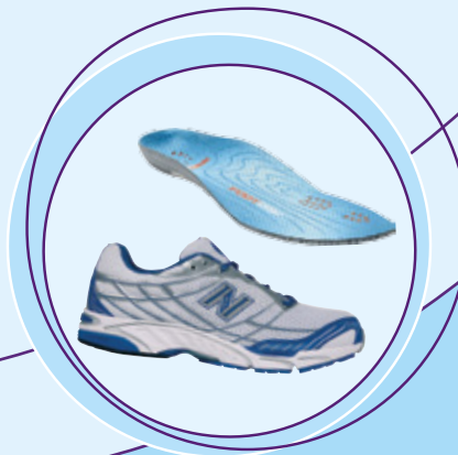
Schuh- und Einlagenempfehlung